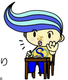
関前コミセン公式キャラクター「セキちゃん」