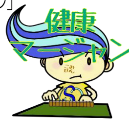
関前コミセン公式キャラクター「セキちゃん」

上記3団体については、コミセン支援団体として登録され、年間を通して利用予約をしていますことから、1か月前の予約開始時にもかかわらず、既にコマが埋まっている場合があります。