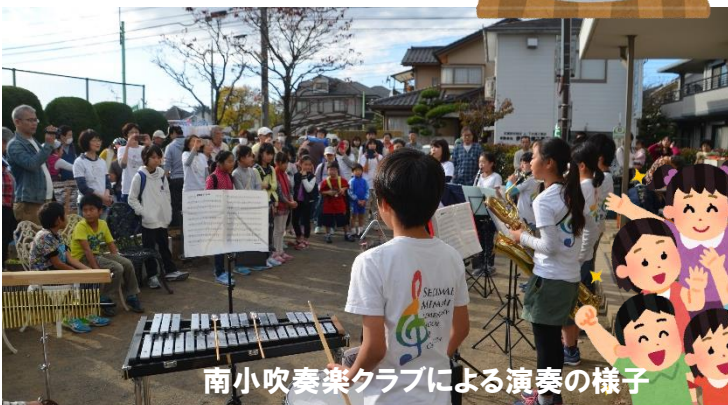
南小吹奏楽クラブによる演奏の様子