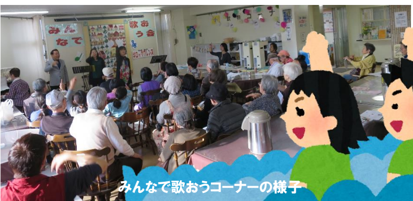
みんなで歌おうコーナーの様子