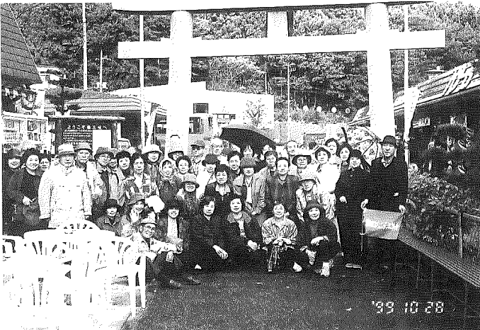
秋のバス研修 (実は楽しい旅行です)