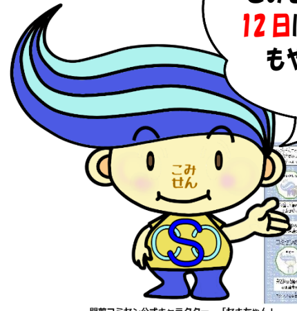
関前コミセン公式キャラクター「セキちゃん」

みなさまの出品・参加お待ちしております! 申込み期間:11月4日(土)~11月8日(水) 受付時間は、10時00分~21時00分まで