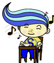
関前コミセン公式キャラクター「セキちゃん」