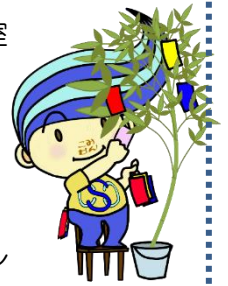
関前コミセン公式キャラクター「セキちゃん」