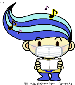
関東コミセン公式キャラクター「ビキちゃん」