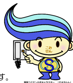
関東コミセン公式キャラクター「ビキちゃん」

当館ご利用時に感染の疑いがある場合には保健所や医師にご相談の上、ご一報いただくと感染拡大予防措置を取ることができるので、ご協力をお願いいたします。ご利用時の状況をお聞きします。