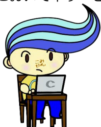
関前コミセン公式キャラクター「セキちゃん」

万が一、本サービスのご利用によって利用者ご自身の損害や第三者との紛争が生じても、武蔵野市及びサービス提供事業者、各コミュニティセンターは一切の責任を負いません。