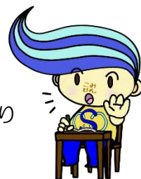
関前コミセン公式キャラクター「セキちゃん」

関前在住の皆さまにご出席いただき、忌憚のないご意見を承ることで、身近で親しみのある関前コミセンとして運営できるよう多くの方のご参加を心よりお待ち申し上げます。