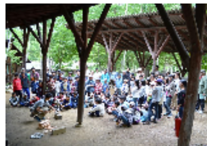
食事作りの前に「まき割かまど指導」