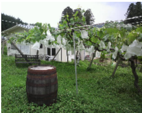
ココファームワイン農園

係りの人による、ココファームが軌道に乗るまでの生徒たちとの苦労話は感動的で、研修にふさわしい