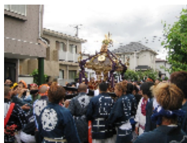
関前コミセン近くの中通りを練り歩くおみこし