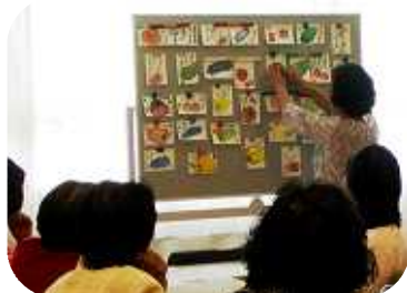
全員の作品を黒板に貼って講師の批評を受ける