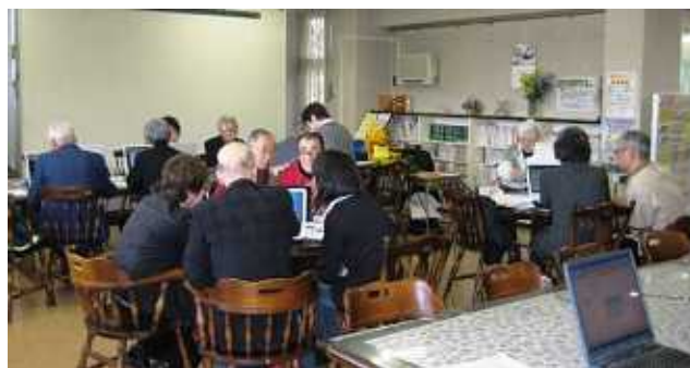
第一回パソコン教室の様子

講習形式：個別指導 事前予約は不要です (多人数を対象とした講義形式ではありません)